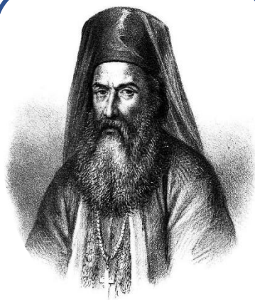
ΠΑΛΑΙΩΝ ΠΑΤΡΩΝ ΓΕΡΜΑΝΟΣ